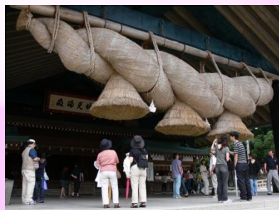
出云大社神乐殿的大注连绳