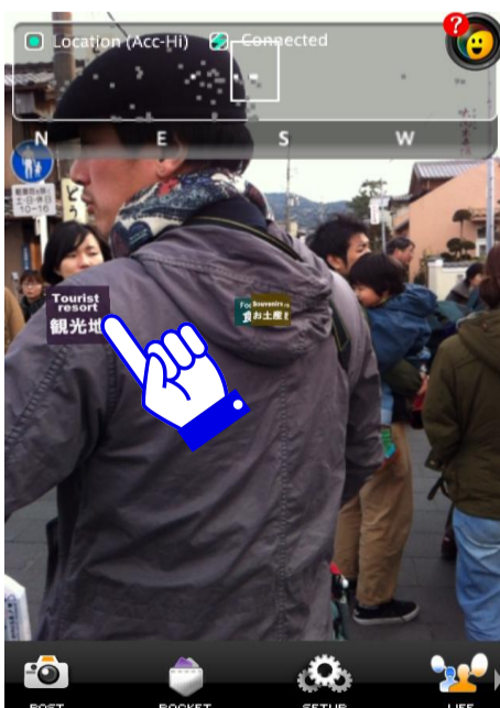
触摸屏幕上的浮动标签就...