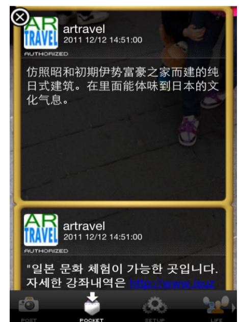
用手滚动画面会看到多国语言信息